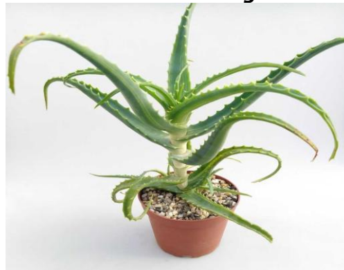
Fra Romano Zago

Pohranite napitak u staklenu bocu, koju ćete držati isključivo u hladnjaku. Konzumacija: Uzimajte 1-2 žlice najmanje pola sata prije jela tri puta na dan. Prije upotrebe bocu dobro promućkajte. Na početku uzimajte 1 žlicu tri puta na dan, a poslije možete povećati dozu na dvije. Smjesa u receptu dovoljna je za 10-12 dana korištenja. Popijte sve. Nakon ove doze pravi se pauza od 10 dana te se tretman ponavlja po potrebi. Tretman se može koristiti zajedno sa zapadnim medicinskim terapijama. Pauza od 10 dana je zbog blage toksičnosti koju biljka posjeduje, iako je mnogi koriste i bez pauza.