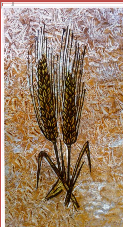
Isus je zrno pšenice koje umire da bi stvorilo vječni život

Zborna molitva Gospodine, Bože naš, tvoj se Sin iz ljubavi za svijet predao u smrt. Daj da i mi tvojom pomoću odvažno stupamo putem njegove ljubavi. Po Gospodinu.