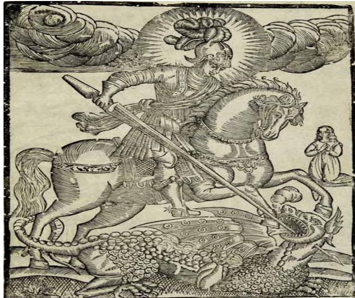
SVETI JURAJ MUČENIK