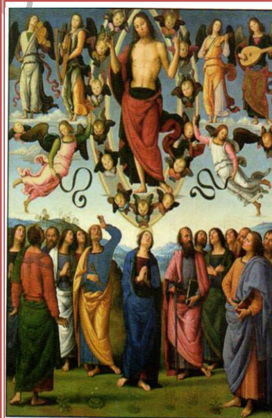
Pietro Perugino, Uzašašće Kristovo, 1496.-1500.

ZBORNA MOLITVA Gospodine, mi vjerujemo da je Spasitelj ljudskog roda sada s tobom u slavi. Usliši nam molitvu: daj da iskusimo njegovu prisutnost s nama do svršetka svijeta, kako je obećao. Po Gospodinu.