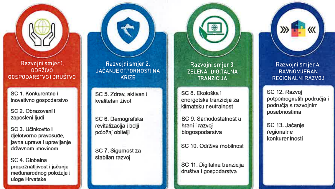
Grafika 2. Razvojni smjerovi i strateški ciljevi Republike Hrvatske do 2030. godine