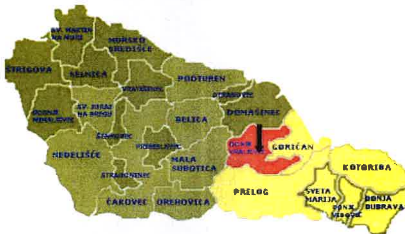
Slika 2. Međimurska županija i položaj Općine Donji Kraljevec